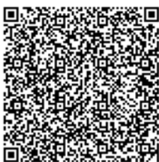
ศูนย์เทเวศร์ มทร.พระนคร