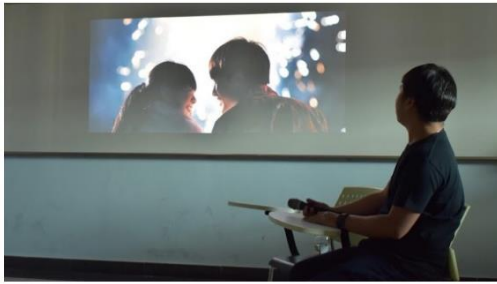
Listen: 'อ่าน' เล่นๆ ก็เป็นหนังสือ