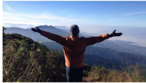
Read: AQ สักเท่าขั้นที่ครองโลก