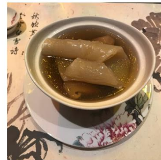
ชิมรสอาหาร ผสานวัฒนธรรม ระดับมิชลินสตาร์ ฟังนี่...