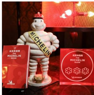
ชิมรสอาหาร ผสานวัฒนธรรม ระดับมิชลินสตาร์ ฟังนี่...