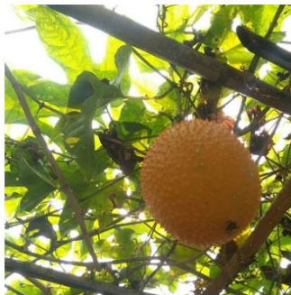
ฟังเพลงแท้ แลต้นพืชข้าว ความสุขที่ไม่ถูกใจ