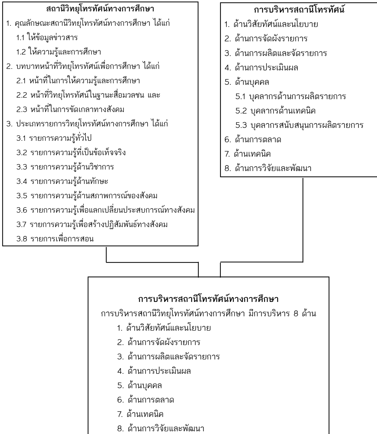
ภาพที่ 2 สรุปการบริหารสถานีวิทยุโทรทัศนทางการศึกษา

จากแนวคิดและทฤษฎีที่เกี่ยวข้องกับสถานีวิทยุโทรทัศนทางการศึกษาและการบริหารสถานีวิทยุโทรทัศน สามารถสรุปออกมาเป็นภาพได้ดังนี้