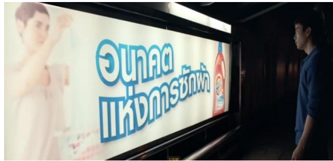
ภาพที่ 2 ป้ายโฆษณาที่แสดงถึงสัญลักษณ์ของความสะอาดสุจริต

อีกต่อไปแล้ว แบนด์ก็ตัดสินใจได้ไม่ยากที่จะเป็นส่วนหนึ่งของการผลิตซ้ำอุดมการณ์ดังกล่าวที่ว่า “เราจะทำต่ออย่างน้อยก็ยังได้เงิน” ในช่วงสุดท้ายของภาพยนตร์ แบนด์ยังคงผลิตซ้ำอุดมการณ์ด้วยการกลับเป็นฝ่ายชักชวนลินมาร่วมธุรกิจการโกงข้อสอบ GAT/PAT ที่สามารถหาเงินเป็นกอบเป็นกำมากกว่า ด้วยวิธีการที่ปลอดภัยกว่าเดิม เพราะต่อให้ถูกจับได้ว่าทำการทุจริตจริงๆ ก็ไม่ได้รับบทลงโทษที่รุนแรงถึงขั้นติดคุก รวมถึงเมื่อพิจารณาถึงผลตอบแทนที่จะได้รับแล้ว มีความคุ้มค่ากว่าการเรียนจนจบมหาวิทยาลัยเพื่อเป็นพนักงานในบริษัท หรือเป็นแค่เจ้าของร้านรับซักรีด ดังความหมายเชิงสัญลักษณ์ (Connotative Sign) บนป้ายโฆษณาในภาพประกอบที่ 2 “อนาคตแห่งการซักผ้า” คือ ความสะอาดสุจริต แต่เมื่อพิจารณาด้วยคู่ตรงข้าม หากแบนด์เลือกที่จะทำการทุจริต ด้วยการเข้าร่วมธุรกิจการโกงข้อสอบ STIC แบนด์ก็จะมีอำนาจทางการเงินเพื่อปรับเปลี่ยนสถานะทางสังคมของตัวเองและแม่