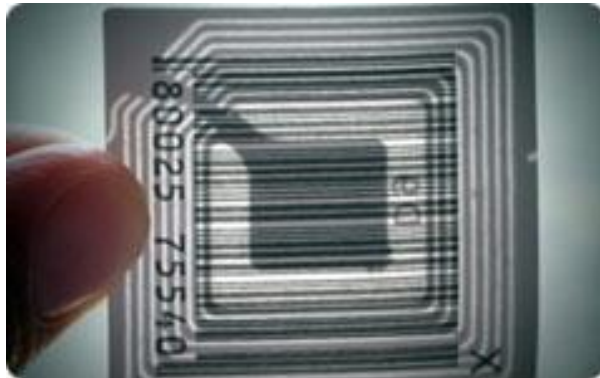
ภาพที่ 3 Passive Tag

(2) Passive Tag ซึ่ง Passive Tag จะไม่มีแบตเตอรี่อยู่ภายใน แต่จะทำงานโดยอาศัยพลังงานไฟฟ้าที่เกิดจากการเหนี่ยวนำคลื่นแม่เหล็กไฟฟ้า (Electromagnetic) จากตัวอ่านข้อมูล จึงทำให้ RFID Tag ชนิด Passive Tag มีน้ำหนักเบากว่า RFID Tag ชนิด Active Tag มีอายุการใช้งานไม่จำกัด มีราคาถูกลงกว่า แต่ข้อเสียคือ ระยะการรับส่งข้อมูลใกล้ และตัวอ่านข้อมูลจะต้องมีความไวสูง นอกจากนี้ Passive Tag มักจะมีปัญหาเมื่อนำไปใช้งานในสิ่งแวดล้อมที่มีสัญญาณแม่เหล็กไฟฟ้ารบกวนสูงอีกด้วย แต่เมื่อเปรียบเทียบทั้งสองชนิดแล้ว Passive Tag เป็นที่นิยมมากกว่าในเรื่องราคาถูกลง และอายุการใช้งานอย่างไม่จำกัด