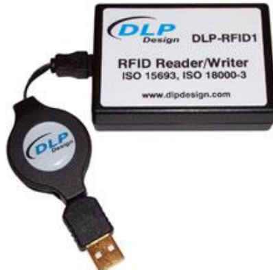
ภาพที่ 4 Reader หรือ Interrogator

ที่เรียกว่า "Batch Reading" ตัว Reader ควรจะมีความสามารถที่จะจัดลำดับการอ่าน RFID Tag แต่ละตัวได้ (สถาบันส่งเสริมความเป็นเลิศทางเทคโนโลยีอาร์เอฟไอดีแห่งประเทศไทย, 2560)