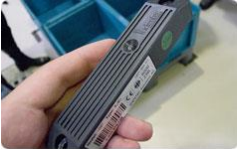
ภาพที่ 2 Active Tag