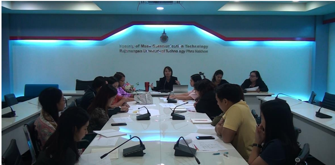
การจัดกิจกรรมแลกเปลี่ยนเรียนรู้