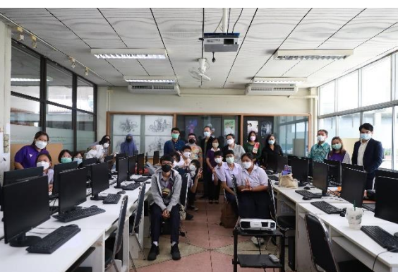
กิจกรรมสาขาวิชาเทคโนโลยีมีเดีย จัดใน (รูปแบบออนไลน์) วันศุกร์ที่ 27 พฤษภาคม 2565