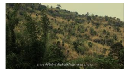
ธรรมชาติเป็นสิ่งที่ดึงดูดใจนักท่องเที่ยวมาเยือน