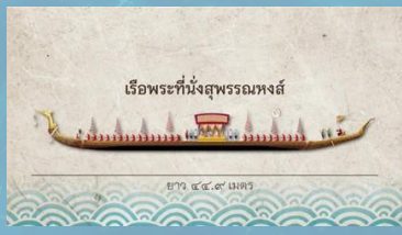
เรือพระที่นั่งสุพรรณหงส์