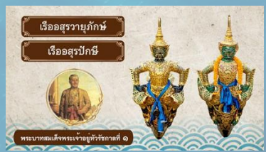
เรือสุรายุภักษ์ เรือสุรปักษ์