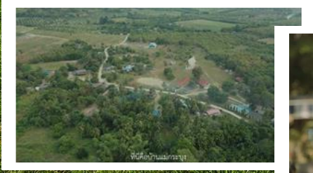
ที่ตั้งบ้านแม่กระบุง