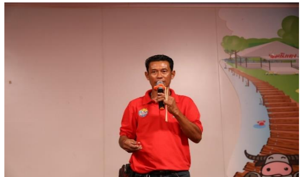
วิทยากรบรรยาย (ช่วงบ่าย)