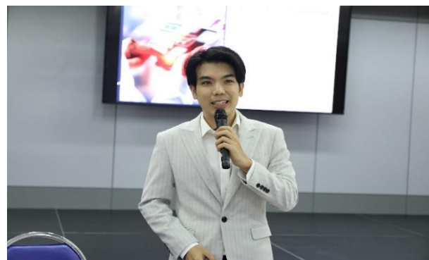
วิทยากรบรรยาย (ช่วงบ่าย)