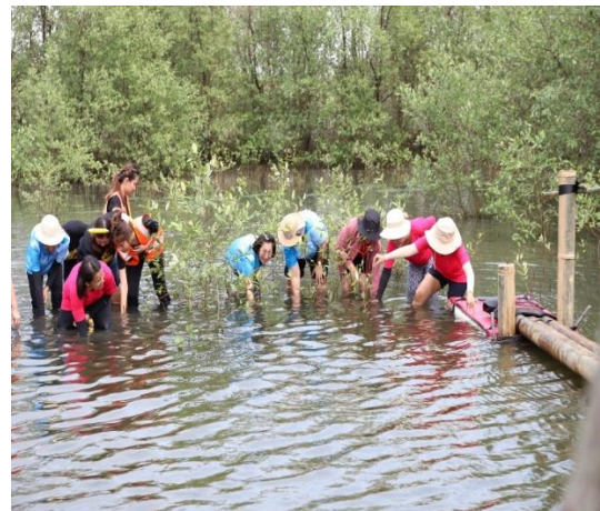
ผู้เข้าร่วมโครงการ