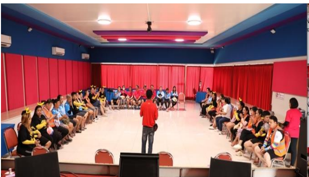
วิทยากรบรรยาย (ช่วงบ่าย)

สถานที่ดำเนินโครงการ : โรงแรมบ้านมณีแดง อำเภอแหลมสิงห์ จังหวัดจันทบุรี