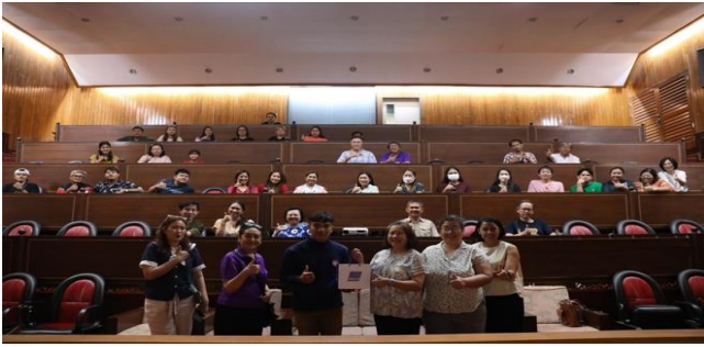
คณบดีมอบของที่ระลึกให้แก่วิทยากร