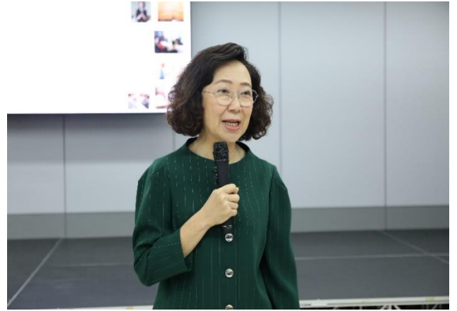
วิทยากรบรรยาย (ช่วงเช้า)