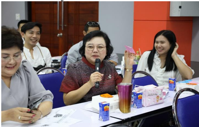
ผู้เข้าร่วมโครงการ