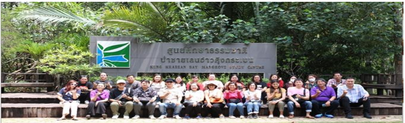
ผู้เข้าร่วมโครงการ

สถานที่ดำเนินโครงการ : ศูนย์ศึกษาการพัฒนาอ่าวคังกระเบนอันเนื่องมาจากพระราชดำริ จังหวัดจันทบุรี