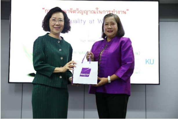
คนบตีมือบของที่ระลึกให้แก่วิทยากร