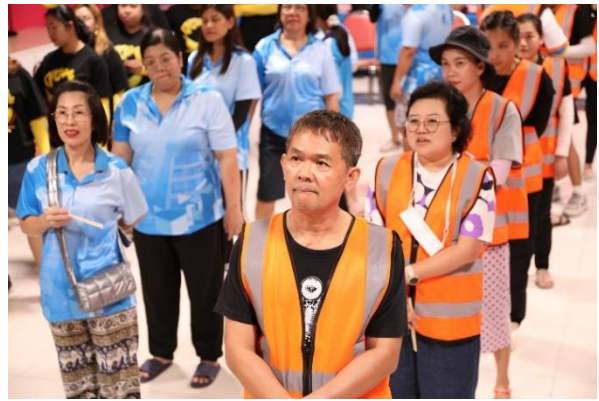
ผู้เข้าร่วมโครงการ