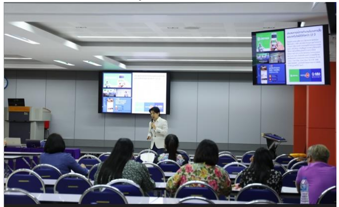
ผู้เข้าร่วมโครงการ