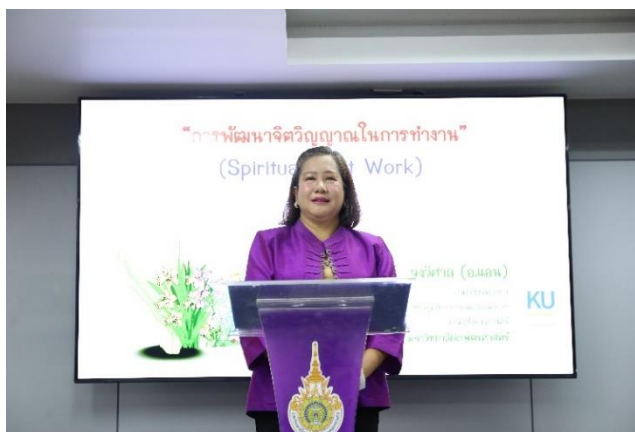
คณบดีกล่าวคำเปิดงาน

สถานที่ดำเนินโครงการ : ห้อง MCT R1204 ชั้น 2 คณะเทคโนโลยีสารสนเทศฯ มหาวิทยาลัยเทคโนโลยีราชมงคลพระนคร