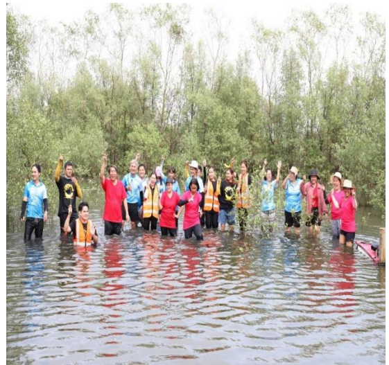
ผู้เข้าร่วมโครงการ