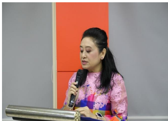
รองคณบดีฝ่ายบริหารกล่าวคำเปิดงาน