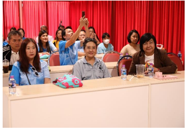
ผู้เข้าร่วมโครงการ