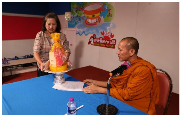
คณบดีถวายสังฆทาน