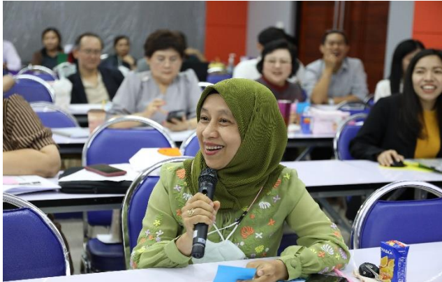
ผู้เข้าร่วมโครงการ