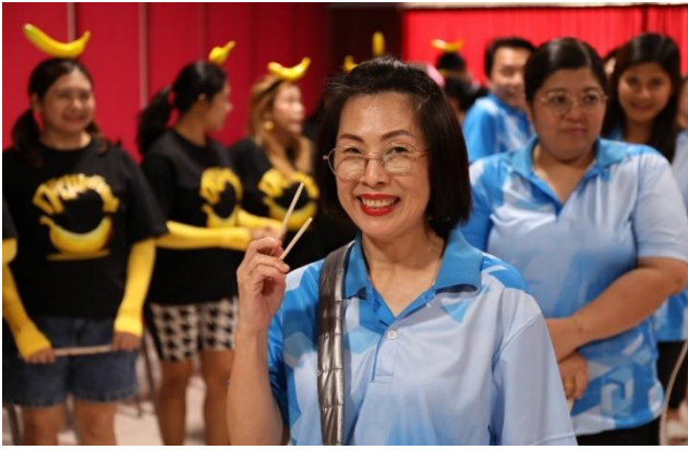
ผู้เข้าร่วมโครงการ