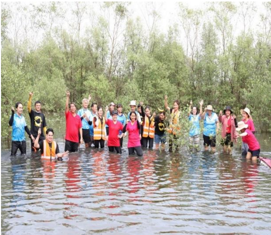
ผู้เข้าร่วมโครงการ

สถานที่ดำเนินโครงการ : บริเวณพื้นที่ป่าชายเลน อำเภอกาญจนดิษฐ์ จังหวัดจันทบุรี