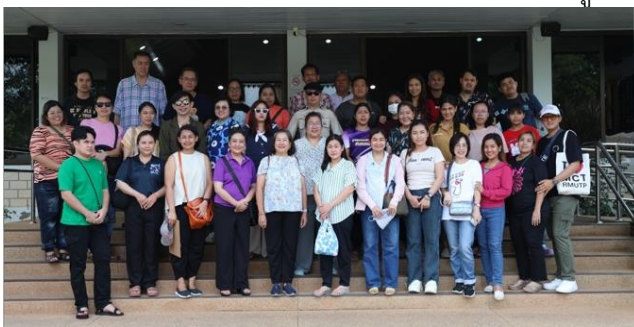
ผู้เข้าร่วมโครงการ