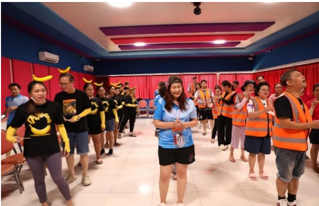
ผู้เข้าร่วมโครงการ