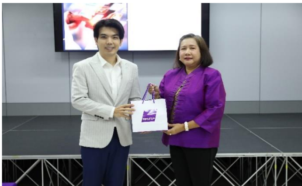
คนบตีมือบของที่ระลึกให้แก่วิทยากร

สถานที่ดำเนินโครงการ : ห้อง MCT R1204 ชั้น 2 คณะเทคโนโลยีสื่อสารมวลชน มหาวิทยาลัยเทคโนโลยีราชมงคลพระนคร