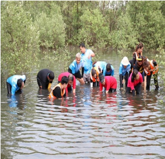
ผู้เข้าร่วมโครงการ