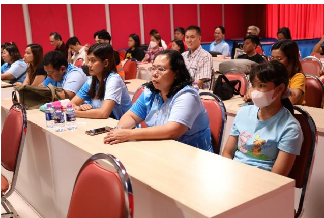
ผู้เข้าร่วมโครงการ