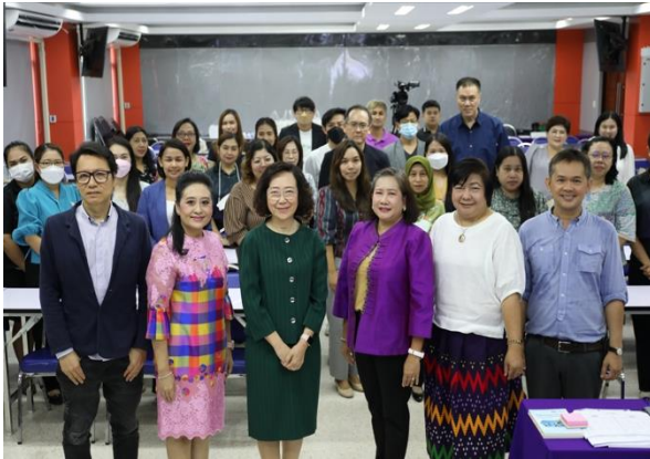
คนบตี วิทยากร และผู้เข้าร่วมโครงการถ่ายภาพหมู่