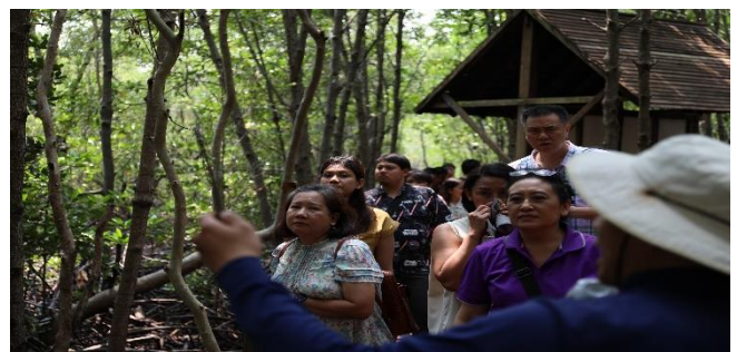
ผู้เข้าร่วมโครงการ