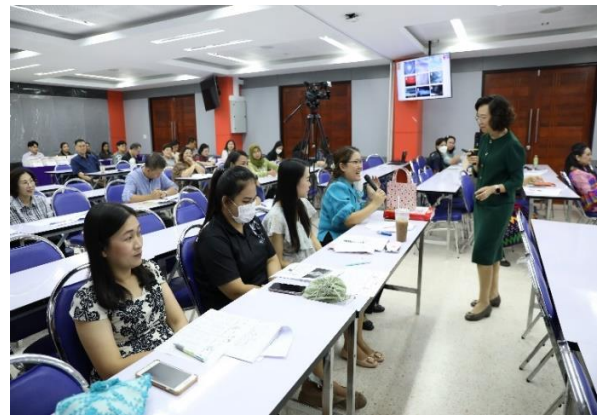
ผู้เข้าร่วมโครงการ