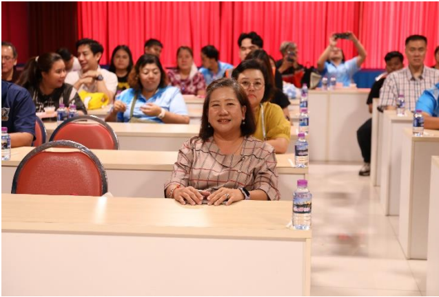
ผู้เข้าร่วมโครงการ