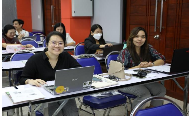
ผู้เข้าร่วมโครงการ