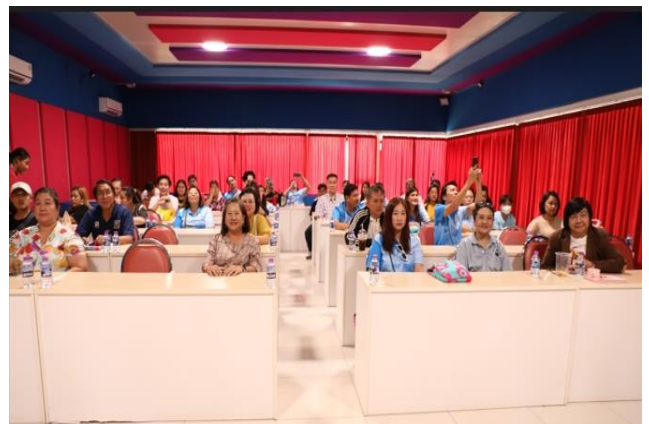
ผู้เข้าร่วมโครงการ

กิจกรรมการฝึกอบรม : การฝึกอบรมเชิงปฏิบัติการเรื่อง การสร้างทีมสู่ความสำเร็จ (Team Building for Success) และ กิจกรรมสัมพันธ์สร้างการทำงานเป็นทีม