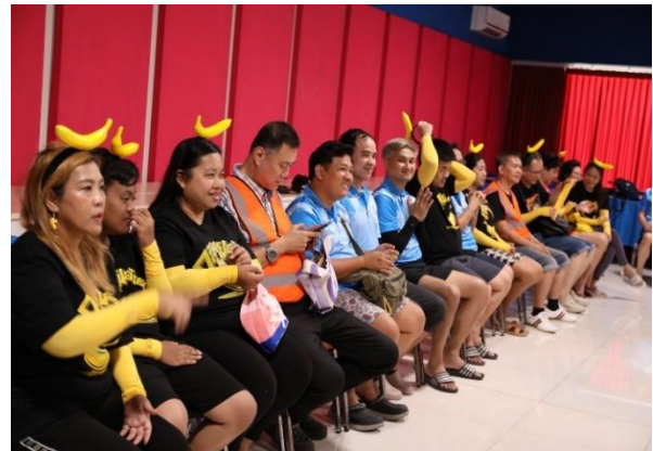
ผู้เข้าร่วมโครงการ