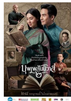
ภาพที่ 4 ภาพจากละครบุพเพสันนิวาส (2561) และภาพยนตร์บุพเพสันนิวาส 2 (2565)