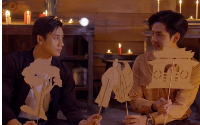
ภาพที่ 6 ภาพจากละครเรื่องคุณชาย