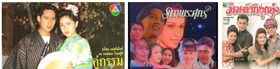
ภาพที่ 3 ภาพละครโทรทัศน์ไทยยอดนิยม ที่มีเรตติ้งสูงที่สุด 3 อันดับแรก คู่กรรม (2532) ดาวพระศุกร์ (2537) และมนต์รักลูกทุ่ง (2538) ตามลำดับ

จากประเด็นของการสร้างวัฒนธรรมมวลชนผ่าน Soft Power ที่กล่าวถึงมานั้น พิจารณาได้จากความสำเร็จของการส่งออกวัฒนธรรมของอุตสาหกรรมบันเทิงของเกาหลีใต้ ที่มีอิทธิพลต่อไทยอย่างสูง เริ่มตั้งแต่การเข้ามาของละครโทรทัศน์ แดจังกึม จอมนางแห่งวังหลวง (2546) ที่ออกอากาศทางสถานีโทรทัศน์ไทยทีวีสีช่อง 3 พร้อมกับอีกหลายประเทศ ซึ่งได้สร้างความนิยมให้กับอาหารเกาหลีใต้โด่งดังไปทั่วโลก จนกลายเป็นต้นแบบของการเผยแพร่ Soft Power ผ่านสื่อบันเทิงให้กับหลายประเทศในโลก ขยายพื้นที่ไปสู่ธุรกิจบันเทิงที่ส่งออกวัฒนธรรมของเกาหลีใต้ตามมาอีกจำนวนมาก อาทิ การสร้างกลุ่มศิลปิน K-Pop ความนิยมในอาหารเกาหลี ไปจนถึงมาตรฐานความสวยหล่อแบบเกาหลี รวมถึงแฟชั่นและการแต่งกายสไตล์เกาหลี ที่ปรากฏอยู่ในสื่อบันเทิงของเกาหลีใต้ ส่วนสะท้อนให้เห็นถึงความสำเร็จดังกล่าว โดยเมื่อศึกษาไปที่ยุทธศาสตร์การพัฒนาศาสตร์ของประเทศเกาหลีใต้พบว่า มีการอิงแนวคิดเกี่ยวกับความทันสมัย เรียกว่า “4S” อันประกอบขึ้นมาจาก Smart (ฉลาด) Safe (ปลอดภัย) Sustainable (ยั่งยืน) และ Strong (เข้มแข็ง) ทั้ง 4S