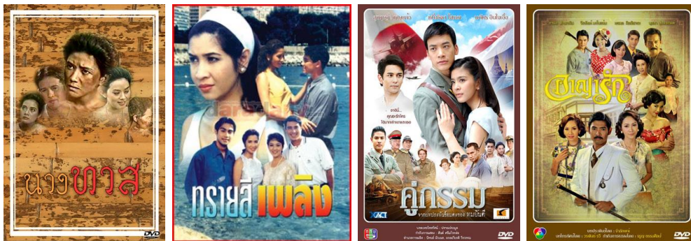
ภาพที่ 1 ละครโทรทัศน์ไทยยอดนิยมที่ถูกผลิตซ้ำเรื่อยมาจากอดีตจนถึงปัจจุบัน นางทาส (2536) ทรายสีเพลิง (2538) คู่กรรม (2556) และอาญารัก (2556) ตามลำดับ ที่มา: ละครไทย (2566)