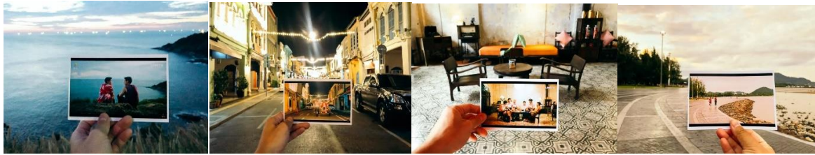
ภาพที่ 5 ภาพสถานที่ท่องเที่ยวเมืองภูเก็ตที่ถูกตามรอยจากจากละครซีรีส์แปลกกันด้วยใจเธอ ที่มา : medium.com (2563)

โดยเฉพาะการสร้างเศรษฐกิจ ซึ่งเป็นส่วนหนึ่งของการสื่อสารทางการตลาด โดยผ่านสังคมและวัฒนธรรมต่างๆ ที่ปรากฏในละครเรื่องนี้ ทั้งอาหาร สถานที่ การท่องเที่ยว และแฟชั่น ซึ่งล้วนแต่สร้างอิทธิพลจนเกิดการแปลงทุนจากละครโทรทัศน์ให้เกิดผลทางเศรษฐกิจได้