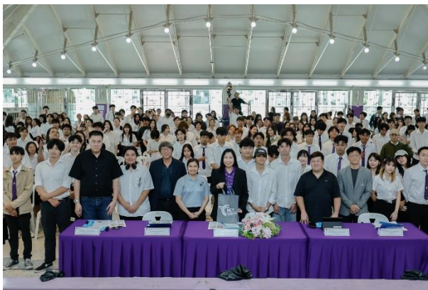
ประกวดโครงงานสหกิจศึกษา