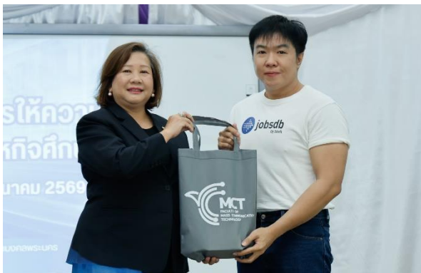
คณบดีมอบของที่ระลึกให้กับวิทยากร