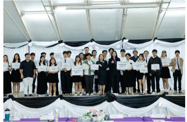
คณบดีมอบเกียรติบัตรให้นักศึกษาที่ส่งโครงการสหกิจศึกษาเข้าประกวด และผลงานสหกิจศึกษาดีเด่น