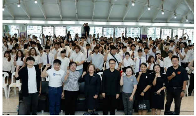
คณบดีคณะเทคโนโลยีสารสนเทศเป็นประธานเปิดโครงการฯ และถ่ายภาพรวมกัน