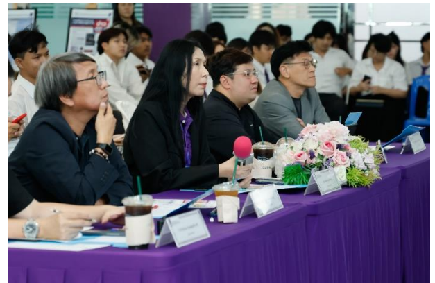
นักศึกษานำเสนอโครงงานบนเวที คณะกรรมการสรุปภาพรวม พร้อมให้คำแนะนำ